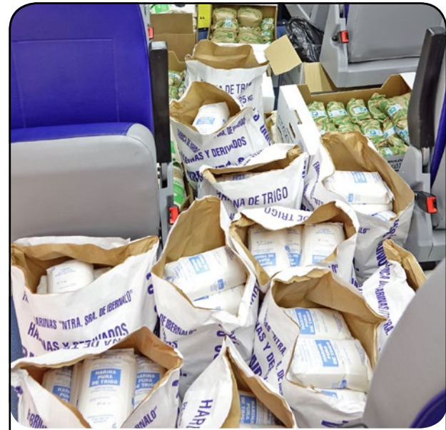
El ayuntamiento dotó con 65.000 euros un plan para la reactivación económica del municipio. Udalak, 65.000 euroko partida sortu zuen udalerriko ekonomia suspertzeko.

Jakinda pandemiak zer zailtasun eta galera utzi dizkigun, elkartasuna erreferente bilakatu zen egunerokotasunean, gaur komunitate indartsuago bat bihurtuta.