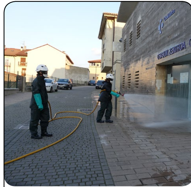
Los Bomberos realizaron una gran labor manteniendo una constante comunicación y coordinación con el ayuntamiento. Suhiltzaileek lan handia egin zuten Udalarekin batera koordinatuz.