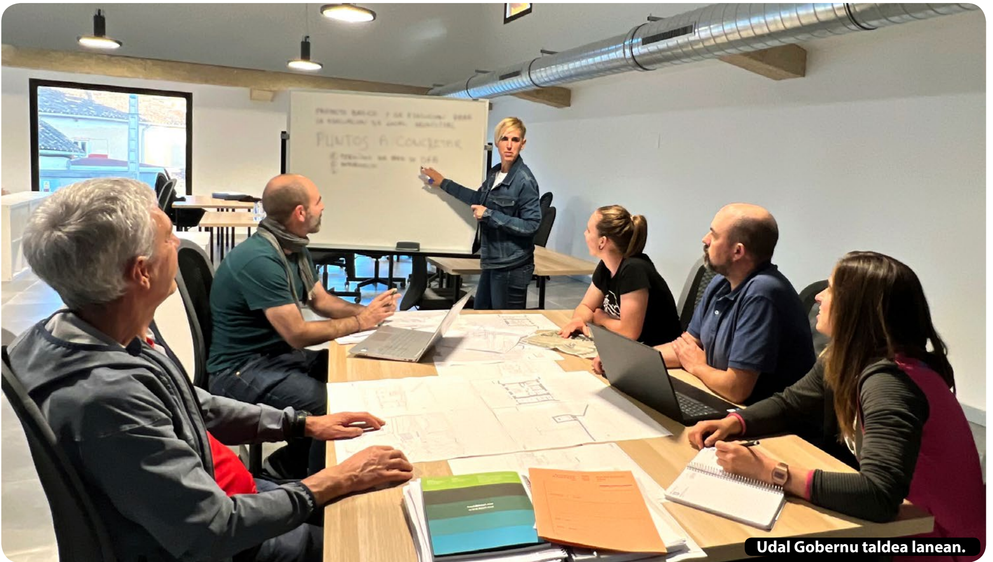
Udal Gobernu taldea lanean.

KAIXO sigue dándole color al municipio. K A I X O k u d a l e r r i a koloreztatzen jarraitzen du.