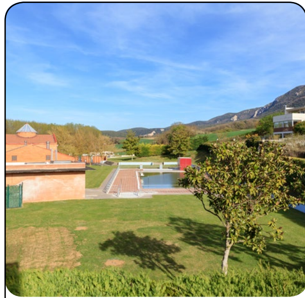
El ayuntamiento después de valorar todas las medidas sanitarias apostó por abrir las piscinas. Udalak, osasun neurri guztiak aztertu ondoren, igerilekuak irekitzearen aldeko apustua egin zuen