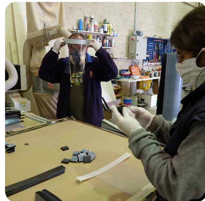
Personas voluntarias cosiendo mascarillas y fabricando pantallas de protección. Bolondresak maskarak josten eta babes-pantailak egiten.