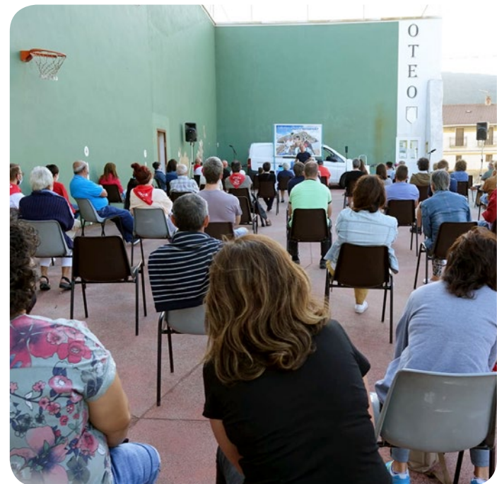
A pesar de las restricciones, la Cultura estuvo presente en nuestros pueblos. Murrizketak egonda ere, kultura presente egon da gure herrietan.